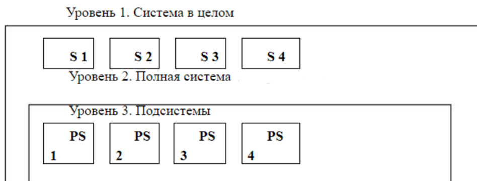
Рис.1. Представление уровней системы; S1, S2 и т.д. – внешние системы, учитываемые при решении задачи; PS1, PS2 и т.д. – подсистемы устройства.