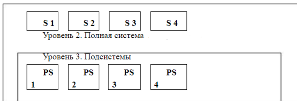
Рис.1. Представление уровней системы; S1, S2 и т.д. – внешние системы, учитываемые при решении задачи; PS1, PS2 и т.д. – подсистемы устройства.