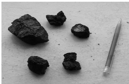
Рис. 3. Твердые продукты пиролиза