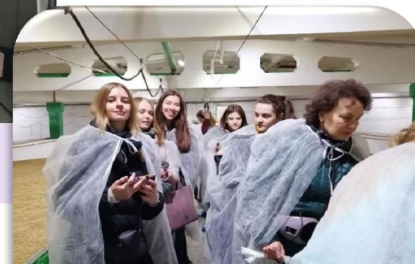
Знакомство с технологиями ОАО «БПЗ»