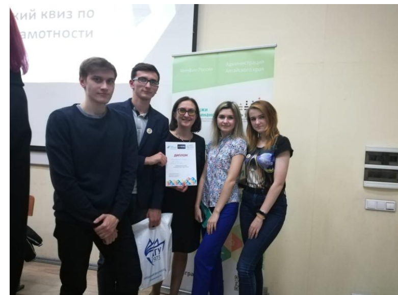
Межвузовский КВИЗ по финансовой грамотности «Финансовый IQ»