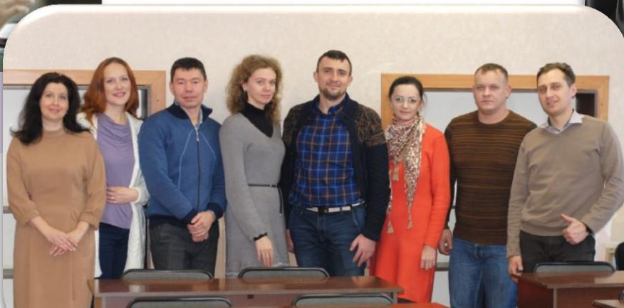
Сотрудничество преподавателей с бизнесом