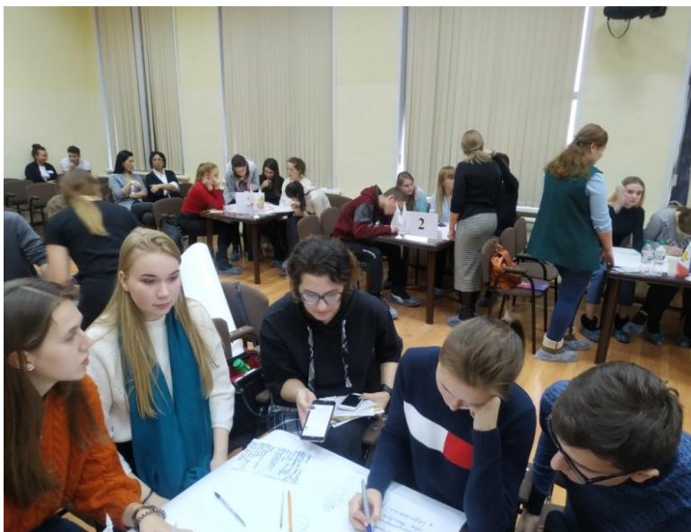
Межвузовский студенческий хакатон по финансовой грамотности