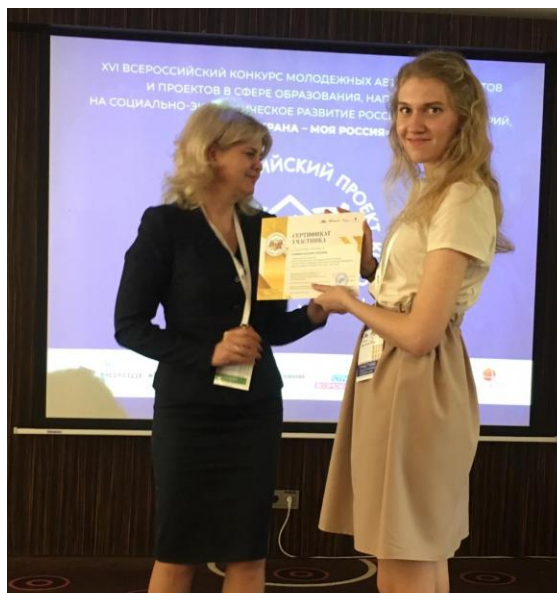
Всероссийский конкурс «Моя страна – моя Россия»